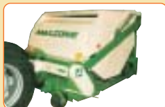
Grasshopper mit Behälter-Hochentleerung