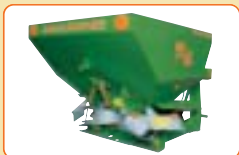
Zweischeibenstreuer ZA-XW Perfect, 500 l