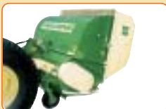
Grasshopper mit Behälter-Bodenentleerung