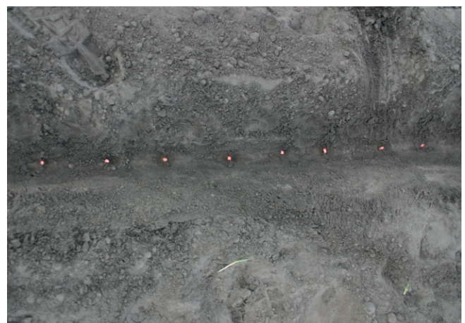
Bild 6: Freigelegte Maiskörner der Sorte Bravissimo bei einer Arbeitsgeschwindigkeit von 12 km/h

Alle beim Feldtest ermittelten Standardabweichungen der Pflanzenabstände sind in Bild 7 in Abhängigkeit der Fahrgeschwindigkeit während der Aussaat dargestellt. Hier zeigt sich der gleiche Trend wie beim