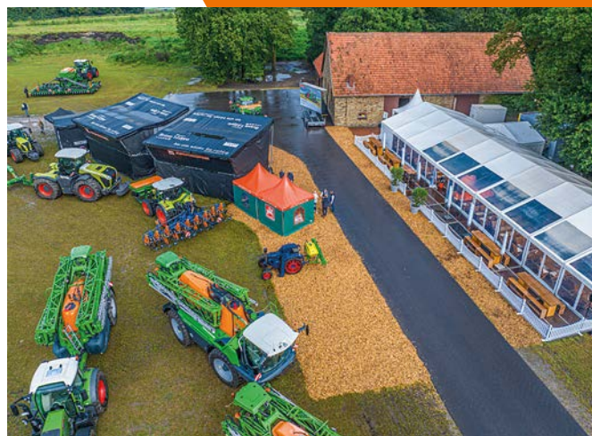
Аерозйомка презентації нової продукції на міжнародній прес-конференції та днях торгових партнерів.