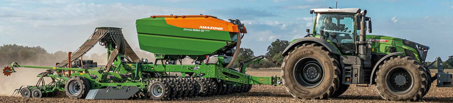
Наш сьогоднішній флагман: причіпна посівна комбінація Cirrus Grand з шириною захвату 9 м (див. також стор. 8).