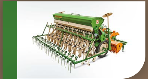
Комбінація RE-D4 від AMAZONE

Вже 75 років AMAZONE виступає за новаторство та якість, коли мова йде про посівну техніку. Незалежно від того, чи йде мова про роботу після обробітку плугом, мульчування або про прямий посів, чи йде мова про навісну, причіпну сівалку або борону, AMAZONE пропонує правильне рішення для будь-якого типу ґрунту і будь-якого виду культури. Завдяки найсучаснішим технологіям, високій точності та простоті експлуатації компанія AMAZONE стала лідером на ринку сівалок. Цього ювілейного року ми святкуємо не лише власний успіх, а й успіх наших споживачів.