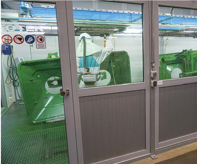
Працівники на заводі з виробництва порошкових фарб.

На наших заводах в Альтмоорхаузені та Лейпцигу вже працює комплекс для порошкового фарбування, слідом за ними, в 2023 році, введено в експлуатацію нову фарбувальну лінію й на нашому головному заводі в Хасберген-Гасте.