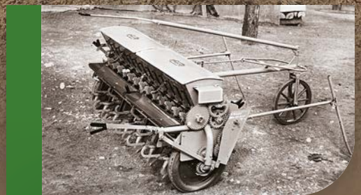
Перша сівалка AMAZONE «D1» в 1949 році.

Вже 75 років AMAZONE виступає за новаторство та якість, коли мова йде про посівну техніку. Незалежно від того, чи йде мова про роботу після обробітку плугом, мульчування або про прямий посів, чи йде мова про навісну, причіпну сівалку або борону, AMAZONE пропонує правильне рішення для будь-якого типу ґрунту і будь-якого виду культури. Завдяки найсучаснішим технологіям, високій точності та простоті експлуатації компанія AMAZONE стала лідером на ринку сівалок. Цього ювілейного року ми святкуємо не лише власний успіх, а й успіх наших споживачів.