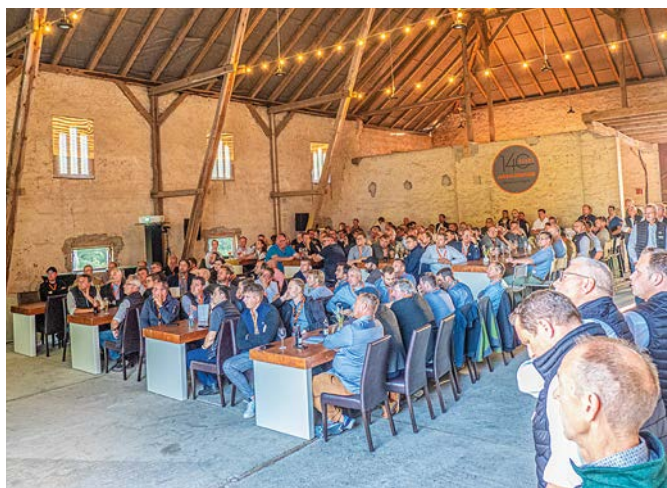
Ласкаво просимо на Дні Торгового Партнера від Крістіана Драєра у Хоф Вамберген з презентацією компанії та інформацією про наші дослідні майданчики з системами CRF (Controlled Row Farming) для рільництва