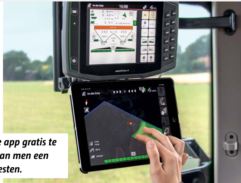
Altijd alles in zicht met de AmaTron Twin- app

Vanaf heden is de app gratis te downloaden en kan men een demo in de app testen.