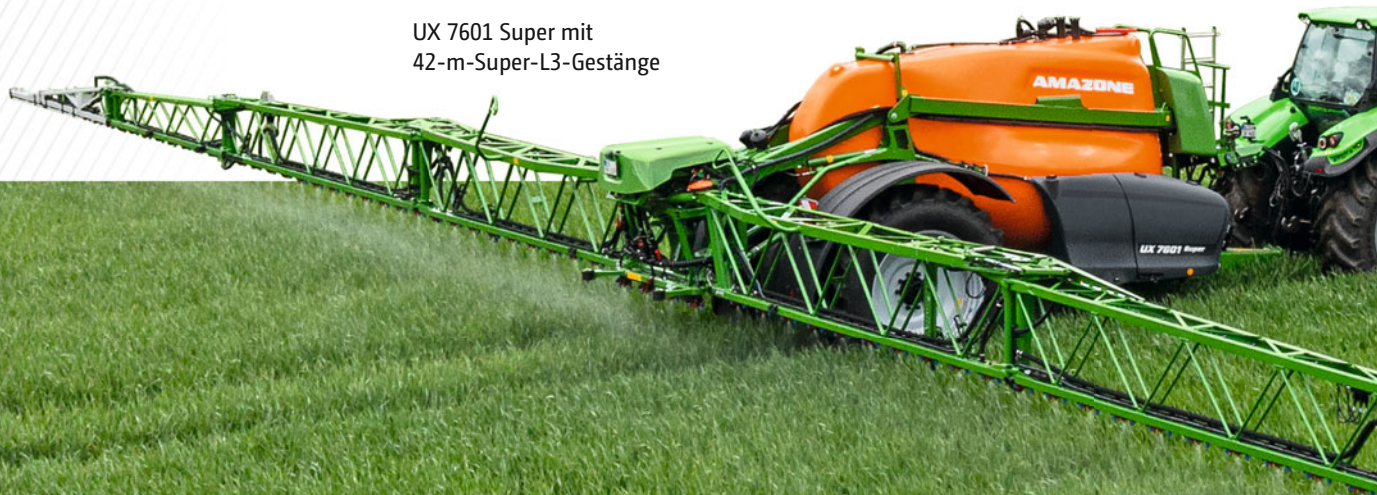
UX 7601 Super mit 42-m-Super-L3-Gestänge