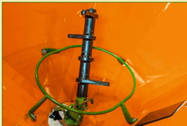
Hydraulischer Streuscheibenantrieb mit streustoffschonendem Rührwerk