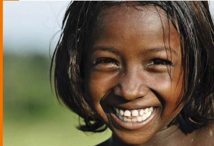
Portrait eines kleinen Mädchens aus Ostindien.