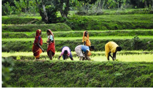
Frauen arbeiten im Reisfeld.