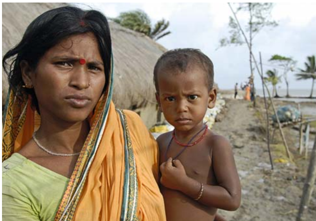
Mutter und Kind in einem überschwemmten Dorf.

Aus diesem Grund unterstützt die Welthungerhilfe 4.500 besonders bedürftige Familien vor Ort. Um diese Unterstützung weiter ausbauen zu können, sind die Welthungerhilfe wie auch die Familien auf Spendengelder angewiesen.