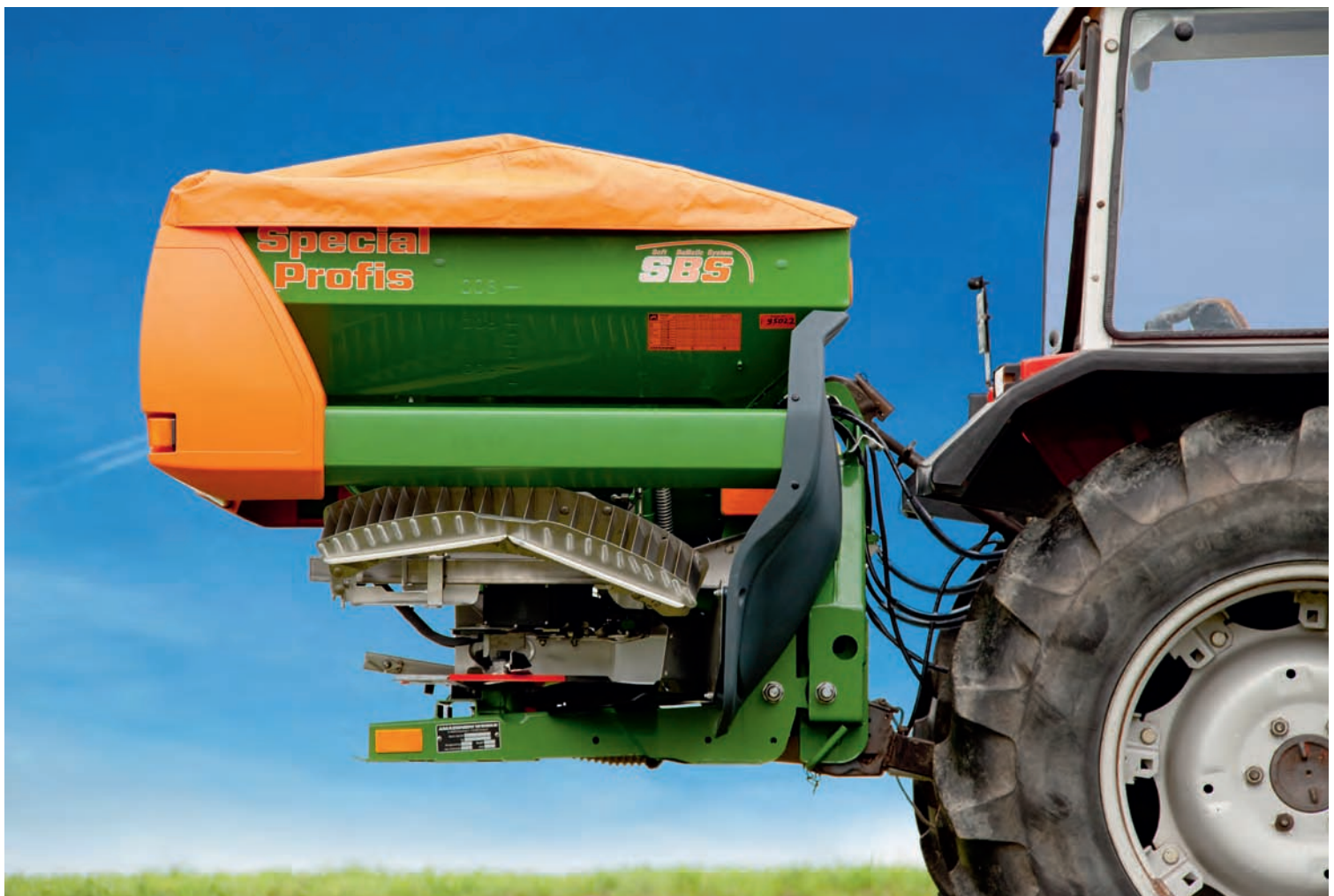
Wiegestreuer liegen stark im Trend. Seit Herbst 2011 bietet Amazone deshalb mit dem ZA-M 1001 Special Profis auch einen leichten und preisgünstigen Wiegestreuer in der 1.000 l-Klasse an. Zur Grundausrüstung gehört hier das Amatron+-Terminal.

Streuern zum Einsatz kommt. Weil die Ausbringungsmengen mit Hilfe des hydraulischen Streuscheibenantriebs elektro-hydraulisch und unabhängig von den Motordrehzahlen geregelt werden, kann der Schlepper mit kraftstoffsparenden, niedrigen Drehzahlen fahren. Außerdem lassen sich die Dosierschieberöffnungen und die Drehzahlen der Streuscheiben unabhängig voneinander ver-