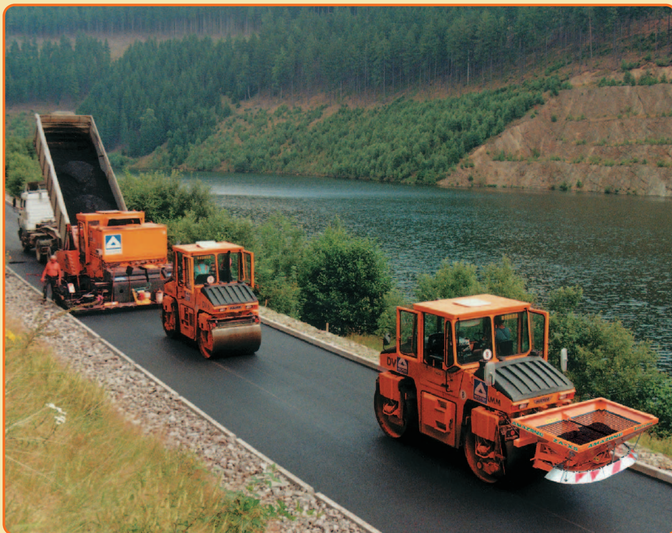
Walzen und Abstumpfen in einem Arbeitsgang