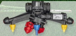
mit 4-fach-DüSENkörper und Verlagerungssatz für einen echten 25-cm-DüSENabstand