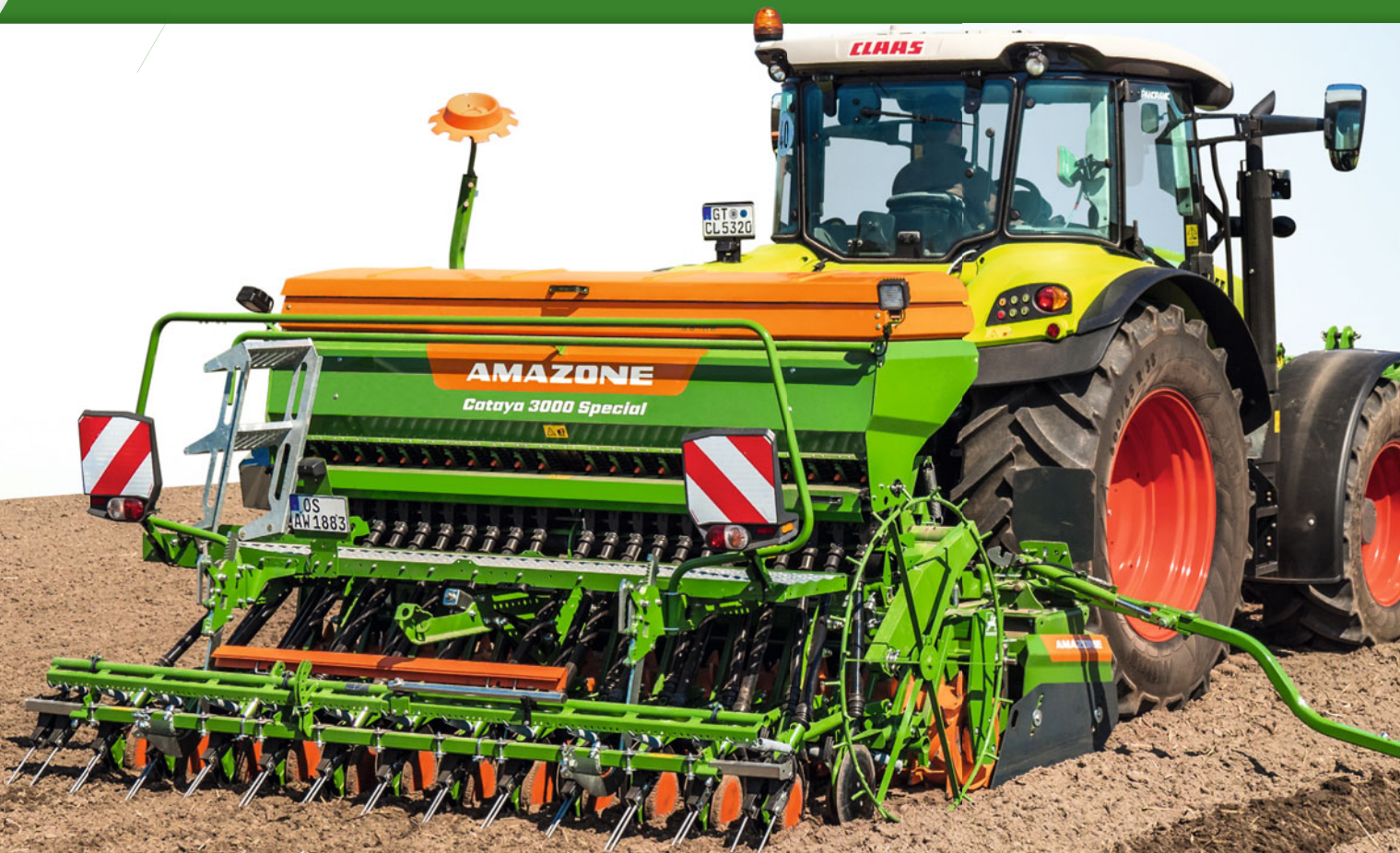
Cataya Special EcoLine

Mechanische opbouwzaamachine Cataya Special EcoLine